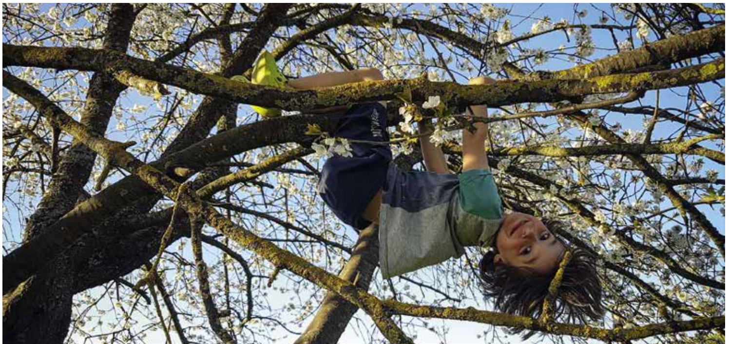
Endlich wieder draußen toben – der Frühling ist da!