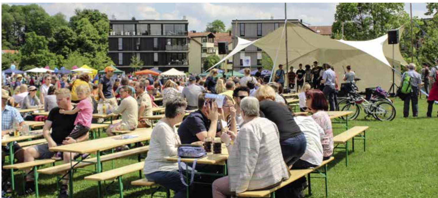
Beim Neubürgerfest 2019 war der Besucherandrang groß – viele Neu-Pfaffenhofener, aber auch Alteingesessene waren der Einladung gefolgt und genossen die Festivalstimmung im Bürgerpark.

Sportlich wird es an den Ständen des MTVs, des Ausdauersport Fördervereins und des DAVs: Beim MTV Lauftreff und dem Ausdauersport Förderverein heißt es an diesem Nachmittag „Run/Walk the City“ – die beiden Vereine laden zu ei-