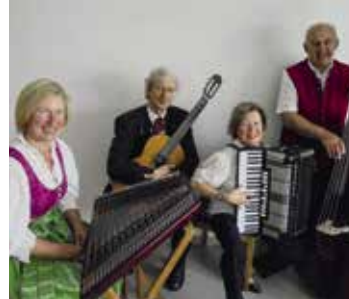
Die Wind'ner Stubenmusik