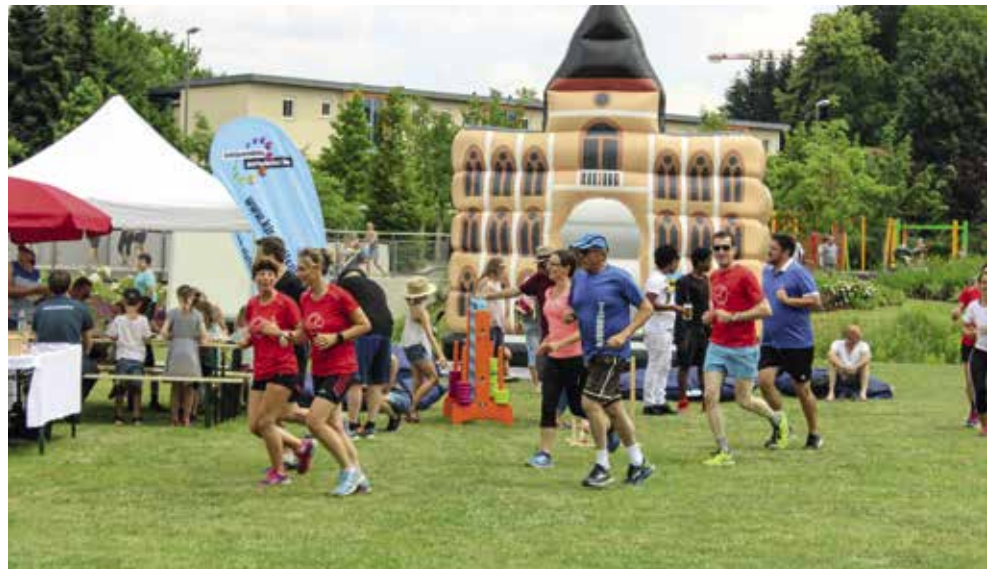
Beim MTV Lauftreff und dem Ausdauersport Förderverein heißt es an diesem Nachmittag „Run/Walk the City“ – die beiden Vereine laden zu einem sechs bis acht Kilometer langen Lauf/Walk quer durch die Stadt ein.

Bevorstehende Veranstaltungen des Vereins sind der 4h-Benefiz-Staffellauf am 23. Juli und der 24. Stadtlauf der Volksbank Raiffeisenbank Bayern Mitte eG am Sonntag, 15. Oktober. Nähere Informationen zum Verein und seinen Veranstaltungen gibt es unter ausdauersport-paf.de