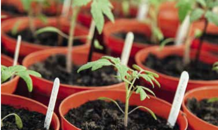
Tomaten lassen sich in einem Topf auf dem Balkon oder der Terrasse anbauen.

In den letzten Jahren hat sich das Interesse an Urban Gardening und nachhaltigem Lebensstil rasant erhöht und der Trend zum Balkongärtnern ist dabei ein herausragendes Beispiel. Von Menschen auf der ganzen Welt werden Balkone und Terrassen als kleine Paradiese genutzt, um frisches, gesundes und biologisch angebautes Obst und Gemüse zu ernten und zu genießen. Der Kreisverband für Gartenkultur und Landespflege hat 2023 daher unter das Motto gestellt: „EssBar – Garteln & Genuss auf kleinstem Raum“.