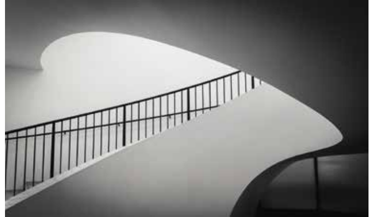
Philipp Hayer: Die Treppe | Fotografie | 2020

Die alljährliche Ausstellung des renommierten Pfaffenhofener Fotoclubs zählt zu den beliebtesten Ausstellungen in der Städtischen Galerie. Auch heuer präsentieren die Mitglieder der Fotofreunde vhs Pfaffenhofen wieder einen Querschnitt ihres facettenreichen Schaffens.