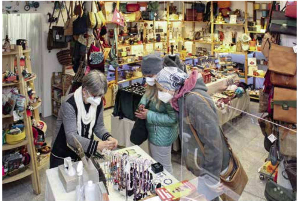
Der Eine Welt Laden Pirapora e. V. hat sich zum Ziel gesetzt, Kleinbauern und Kleinhandwerker in Entwicklungs- und Schwellenländern durch faire Preise zu unterstützen.

Der Verein freut sich sehr über neue Mitarbeiterinnen und Mitarbeiter. Kontakt aufnehmen kann man im Laden und unter 08441 278732 und per E-Mail an: vorstand@eineweltladen-pfaffenhofen.de . Infos unter pirapo01.bn-paf.de