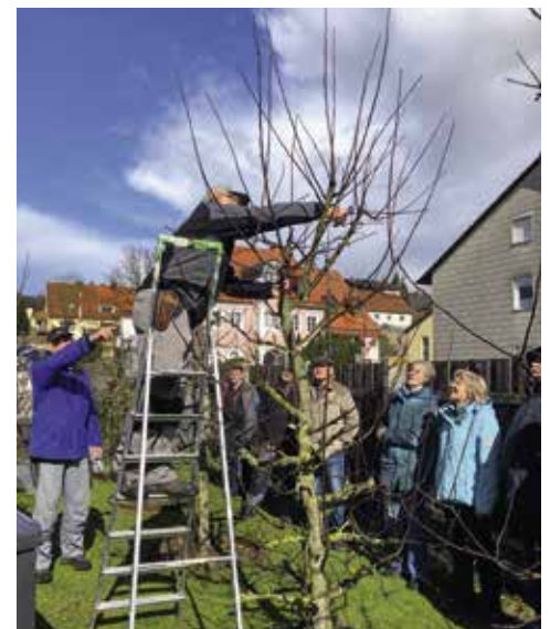
Links: Wer das Tischtennis spielen gerne einmal ausprobieren möchte, hat dazu am MTV-Infostand beim Neubürgerfest die Möglichkeit. Rechts: Der Obst- und Gartenbauverein gibt vor Ort u. a. wertvolle Tipps zum Schnitt und zur Pflege von Obstbäumen und Blumengärten.