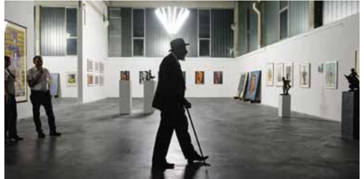
Der Künstler Markus Lüpertz bei seiner Ausstellung in der Kunsthalle 2014

Der Neue Pfaffenhofener Kunstverein wird mit dem Kulturpreis 2023 der Stadt ausgezeichnet. Der Stadtrat hat auf Empfehlung des Kulturausschusses einstimmig beschlossen, dass er an den seit 15 Jahren bestehenden Kunstverein geht. Die Verleihung findet im Rahmen der Paradiesspiele statt.