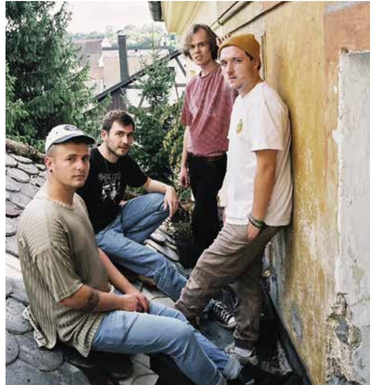
Die Pawn Painters aus Schrobenhausen gewannen 2016 das Saitensprung-Festival und sitzen nun selbst in der Jury.

Am 18. Mai, an Christi Himmelfahrt, findet wieder das alljährliche Nachwuchsband-Festival Saitensprung statt. Zwischen 12 und 23.30 Uhr finden dann junge Musiktalente einen Platz auf der Bühne im Sport- und Freizeitpark.