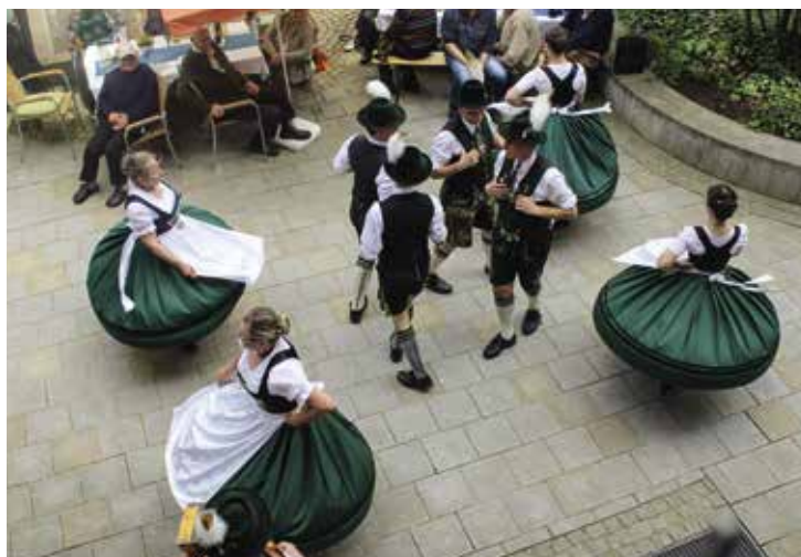
Der Pfaffenhofener Trachtenverein wird anlässlich der Jubiläumsfeier auftreten.