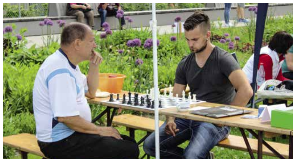
Egal welches Alter oder Schacherfahrung, bei der offenen Schachgruppe sind alle willkommen.