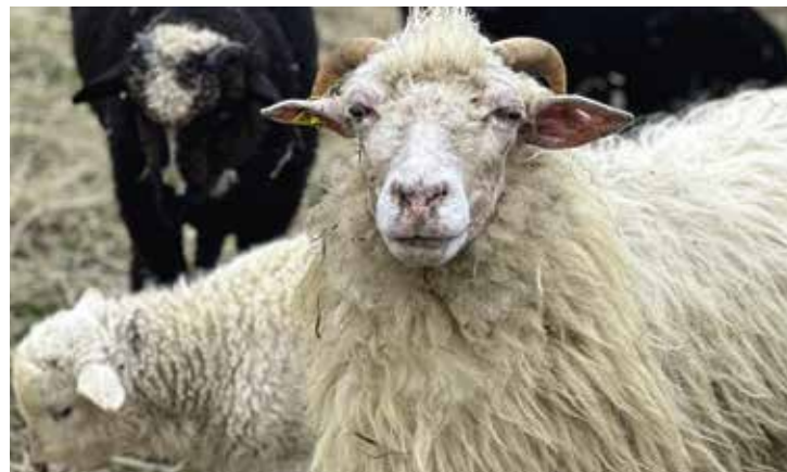
Das Waldschaf ist eine gefährdete Hausschaf rasse, die überwiegend in Bayern und Österreich beheimatet ist.

fernt werden, sondern noch genug Pflanzenmaterial als Nahrung und Rückzugsraum für Insekten vor-