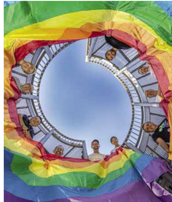
Der Verein Queer engagiert sich mit viel Herzblut für eine queerfreundliche, tolerante Gesellschaft.

Haus der Begegnung tun. Tracht ist dafür keine Voraussetzung. Diese kann ausgeliehen werden. Weitere Informationen gibt es unter trachtenverein-pfaffenhofen.de .