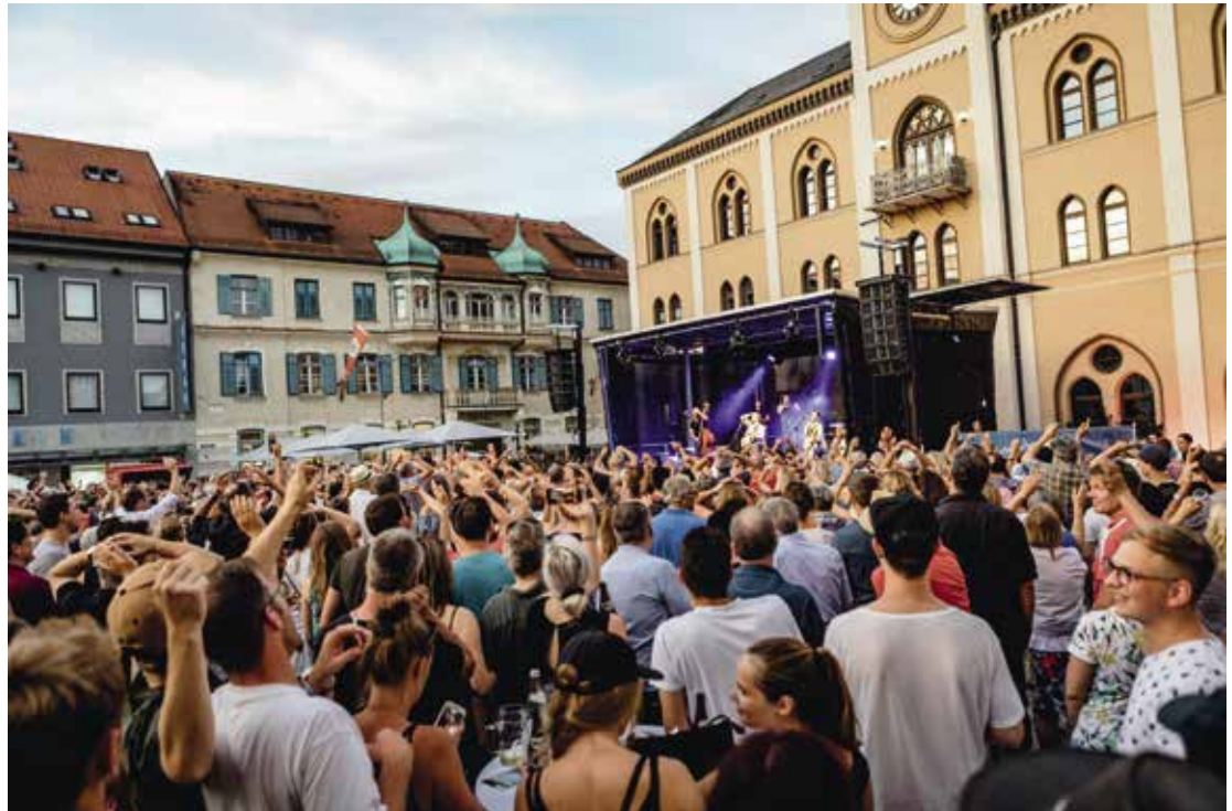
Ausgelassene Feierstimmung bei einem Konzert auf dem Hauptplatz bei den Paradiesspielen 2018.